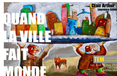
876 écoliers et collégiens réunis autour d'un même projet créatif et monumental

Un projet monumental créé en 2021 que TEM a décidé d'accueillir. Les grands formats réalisés par les élèves y seront présentés, entremêlés de productions plus personnelles de Clair Arthur.