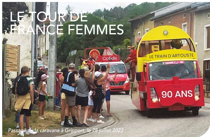
Passage de la caravane à Gripport, le 28 juillet 2022

POUR LA 1 RE ÉDITION DE CETTE NOUVELLE FORMULE DU TOUR DE FRANCE FEMMES AVEC NOTAMMENT POUR LA 1 RE FOIS LA TRÈS ATTENDUE CARAVANE PUBLICITAIRE, LE SUCCÈS A ÉTÉ AU RENDEZ-VOUS.