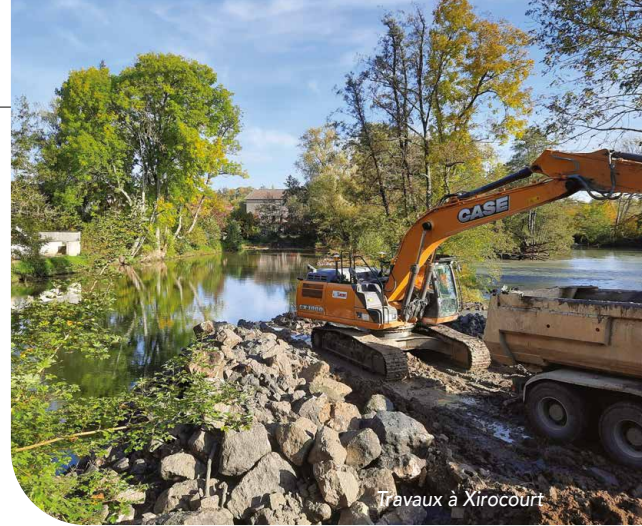
Travaux à Xirocourt

2 communes sera lancée dès cet hiver : coupe d'arbres morts, retrait d'embâcles, et replantations. L'objectif est de réduire les embâcles pouvant bloquer la circulation de l'eau, et de rafraîchir une végétation vieillissante.