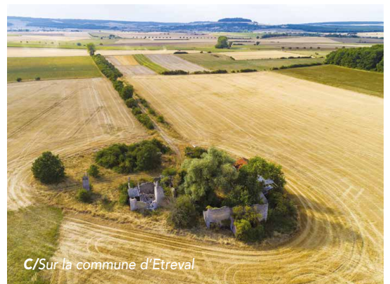
C/Sur la commune d'Etreval