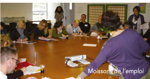
Moissons de l'emploi