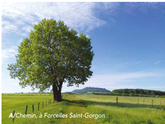
A/Chemin, à Forcelles Saint-Gorgon

• « Arbres remarquables » • « Patrimoine caché » • « La nature dans tous ses états ». Le concours proposait aussi pour la 1 re fois une catégorie enfant, l'invitant à photographier un lieu dans la nature qu'il apprécie particulièrement. Voici les gagnants et leurs photos :