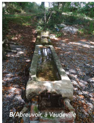
B/Abreuvoir, à Vaudeville