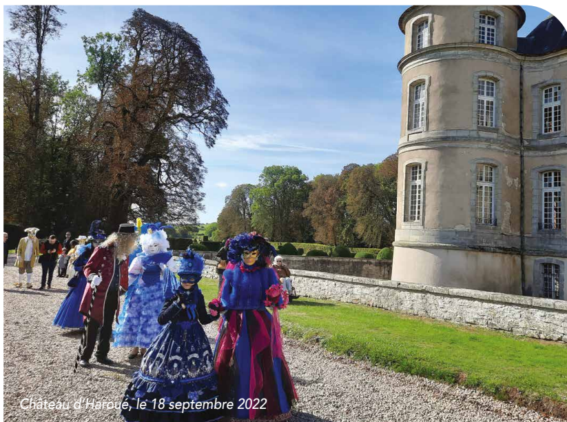
Château d'Haroué, le 18 septembre 2022

Pour cette nouvelle édition des Journées Européennes du Patrimoine, rendez-vous incontournable sur le territoire, fort de nombreuses richesses culturelles à valoriser, un important programme avec une quinzaine de rendez-vous étaient organisés, notamment : la visite guidée et dégustation des brasseries La Lorraine Perdue et Okabeer ; La visite guidée des châteaux d'Étreval, de Thorey Lyautey et d'Haroué avec la déambulation d'une troupe de carnaval vénitien costumée pour ce dernier ; La visite guidée du bourg castral médiéval et des fortifications de Vaudémont ; La visite des églises Saint-Côme-et-Saint-Damien avec récital d'orgue (à Vézelize), Saint-Etienne (à Voinémont) et de la Chapelle Notre-Dame de Pitié (à Xirocourt). Merci à tous les bénévoles rendant cet événement si dynamique sur le territoire.