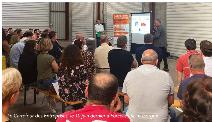
Le Carrefour des Entreprises, le 10 juin dernier à Forcelles Saint Gorgon

Aujourd'hui, une situation inédite questionne les acteurs de cette opération : le travail ne manque pas et... ne trouve pas preneur. Accompagnement personnalisé, échange et soutien entre pairs, action collective sont autant de valeurs qui ont nourri les acteurs des Moissons. A situation nouvelle, une réponse nouvelle s'impose. Être au plus près des demandeurs d'emploi et des acteurs économiques en les accompagnant activement et conjointement.