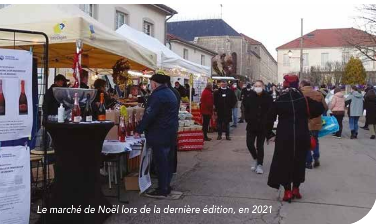
Le marché de Noël lors de la dernière édition, en 2021

LE PÈRE-NOËL POSE UNE NOUVELLE FOIS SON TRAÎNEAU SUR LA COLLINE DE SION, LES 10 & 11 DÉCEMBRE PROCHAINS AVEC POUR THÈME : L'ÉCO-RESPONSABILITÉ.