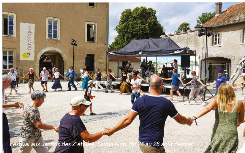
Festival aux Jardins des Z'étoiles, Saxon-Sion, du 24 au 28 août dernier

LA COLLINE DE SION, THÉÂTRE DE NOMBREUX ÉVÉNEMENTS, TOUTE L'ANNÉE.