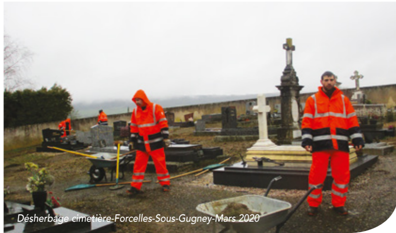
Désherbage cimetièra-Forcelles-Sous-Gugney-Mars 2020