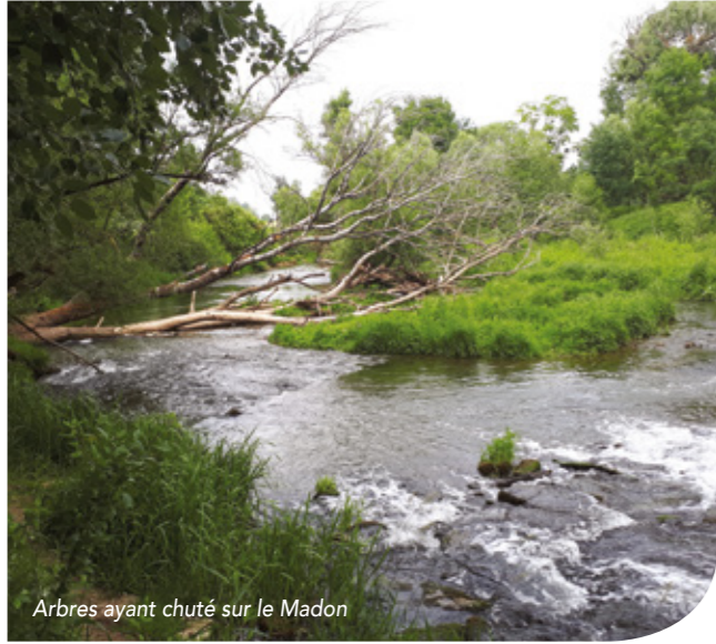
Arbres ayant chuté sur le Madon

DANS LE CADRE DE SA COMPÉTENCE GEMAPI, LA CCPS A DÉLÉGUÉ, DANS UN SOUCI DE COHÉRENCE À L'ÉCHELLE DU BASSIN DU MADON, LA PROBLÉMATIQUE DES INONDATIONS À L'EPTB MEURTHE MADON (ETABLISSEMENT PUBLIC TERRITORIAL DE BASSIN). UN PROGRAMME D'AMÉNAGEMENT ET DE PRÉVENTION DES INONDATIONS EST D'ORES ET DÉJÀ EN RÉFLEXION SUR L'ENSEMBLE DU LINÉAIRE DU MADON, DONT L'ACHÈVEMENT EST PRÉVU EN 2026.