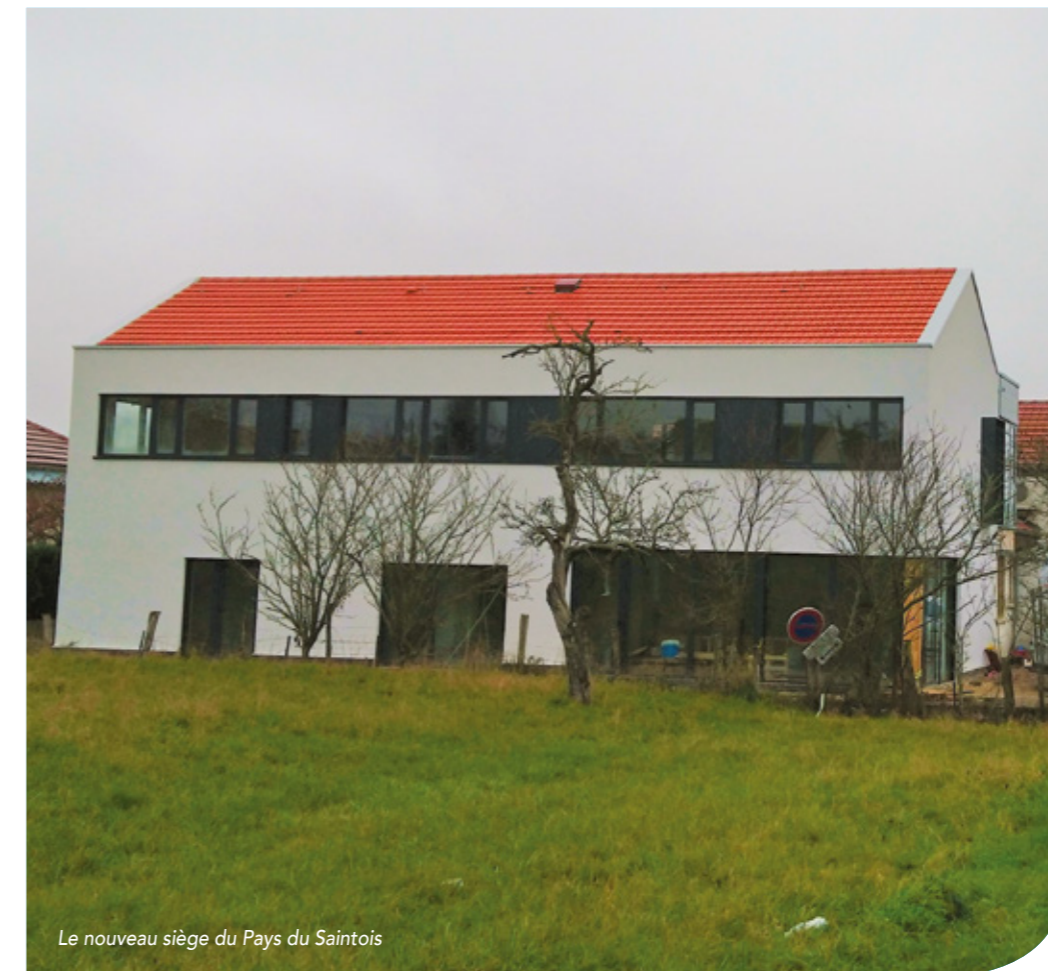
Le nouveau siège du Pays du Saintois

DEPUIS 2016, LA COMMUNAUTÉ DE COMMUNES A ENTREPRIS UNE RÉFLEXION SUR L'OPTIMISATION DE SON SIÈGE ADMINISTRATIF.