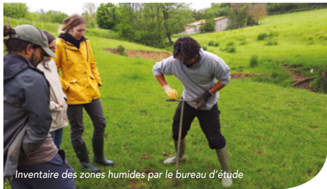
Inventaire des zones humides par le bureau d'étude

Vous pourrez retrouver ces actions en détail lors d'événements ponctuels, comme lors de la fête de la nature qui a eu lieu en octobre dernier. Celle-ci a par exemple été l'occasion de présenter les grands réservoirs de biodiversité du territoire, et les différents corridors permettant de les relier.