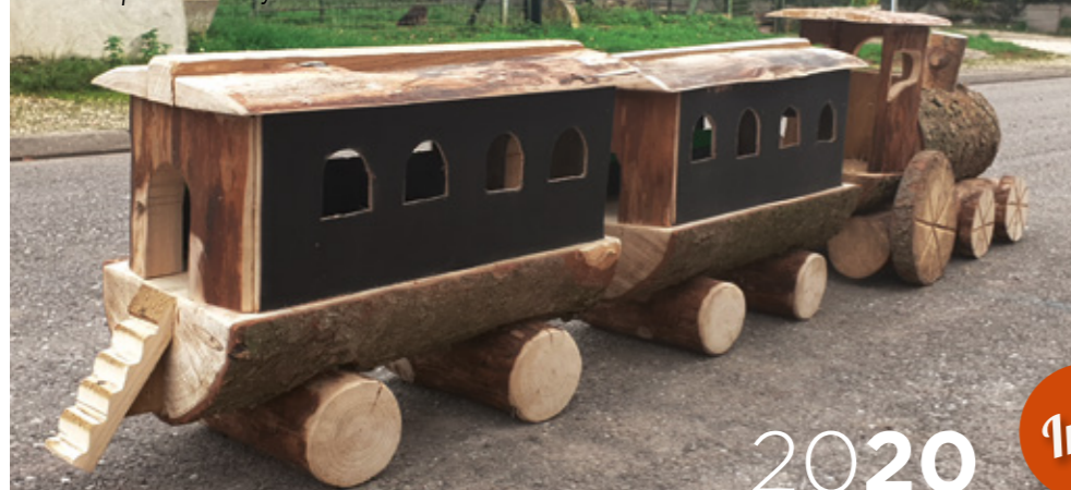
Le train éphémère du foyer rural de Tantonville