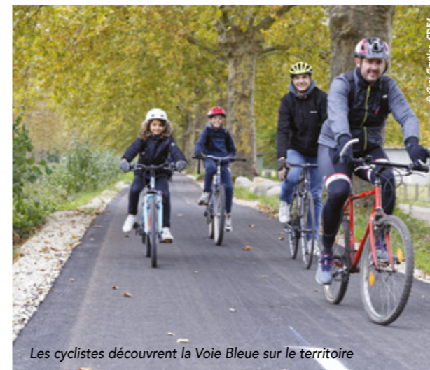
Les cyclistes découvrent la Voie Bleue sur le territoire