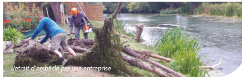
Retrait d'embâcle par une entreprise

Plus d'informations sur le PAPI Madon sur : www.eptb-meurthemadon.com