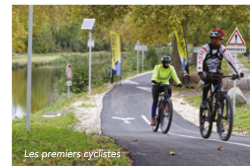
Les premiers cyclistes