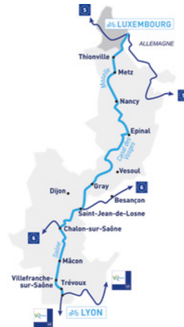
Itinéraire de la V50