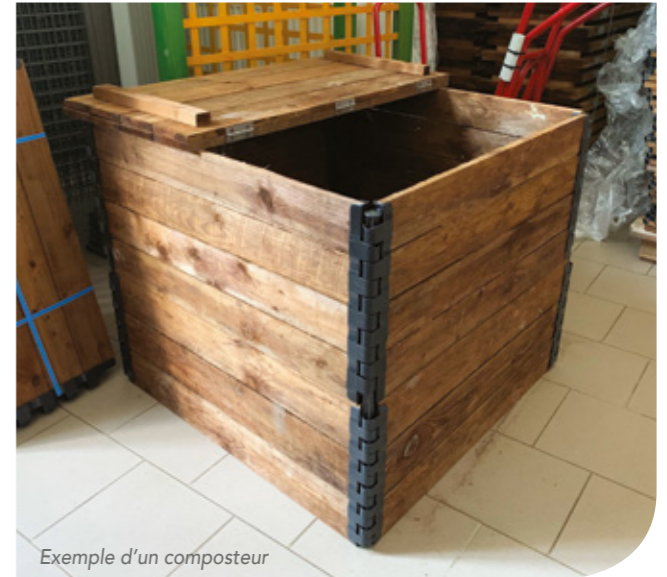
Exemple d'un composteur

Les bons de commande sont à renvoyer avant le 15 février 2021 pour un retrait en avril 2021, et avant le 15 juillet 2021 pour un retrait en septembre 2021. Les composteurs seront à venir chercher en kit à la Maison des Animations de la CCPS à Vaudigny. Inutile de joindre un règlement à votre commande, le montant sera ajouté à votre prochaine facture ordures ménagères.