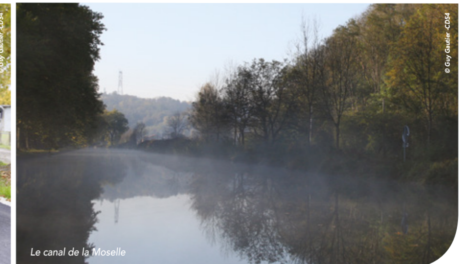
Le canal de la Moselle