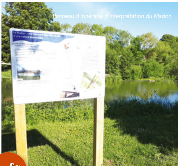
Panneau d'itinéraire d'interprétation du Madon

Au travers de cette compétence, la CCPS a déjà :