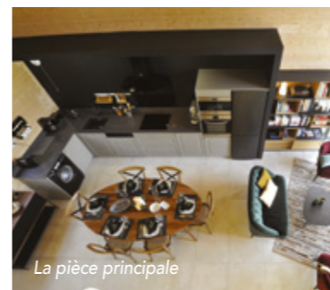
La pièce principale

AU COURS DES DEUX DERNIÈRES ANNÉES, 3 GÎTES À LA QUALITÉ ADMIRABLE ONT VU LE JOUR SUR LE TERRITOIRE PAYS DU SAINTOIS.