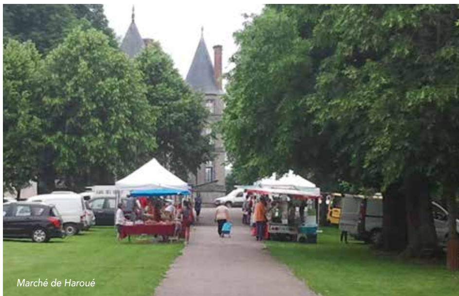
Marché de Haroué

Mais à l'heure du concours du « Plus Beau Marché de France » que recherche le consommateur ? Un retour au terroir, aux valeurs locales, aux circuits dit courts,... Cela n'a pas échappé à