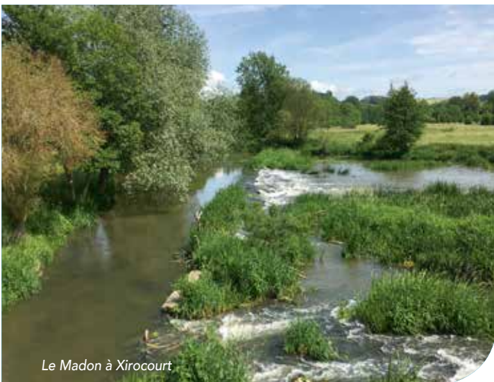
Le Madon à Xirocourt