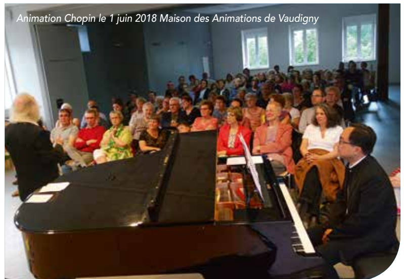
Animation Chopin le 1 juin 2018 Maison des Animations de Vaudigny