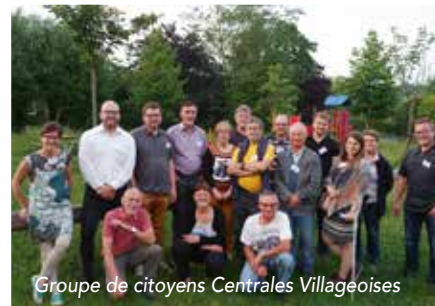
Groupe de citoyens Centrales Villageoises

C'est l'un des objectifs des Centrales Villageoises de production d'électricité d'origine photovoltaïque, dont le nombre ne cesse d'augmenter depuis dix ans sur le territoire national, traduisant l'implication des habitants des territoires locaux dans la création de sociétés à gouvernance citoyenne (1 pers. = 1 voix) avec comme objectifs, le développement des « énergies vertes » et la sensibilisation des populations à la nécessité de réformer nos modes de vie et de consommation.