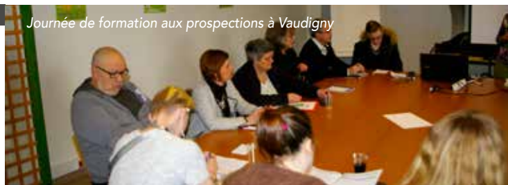
Journée de formation aux prospections à Vaudigny

Fin 2018, un bilan sera publié ici avec à la clé un projet ambitieux de mutualisation solidaire dans le monde du travail, sur l'ensemble de notre territoire.