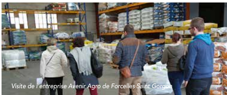
Visite de l'entreprise Avenir Agro de Forcelles Saint Gorgon