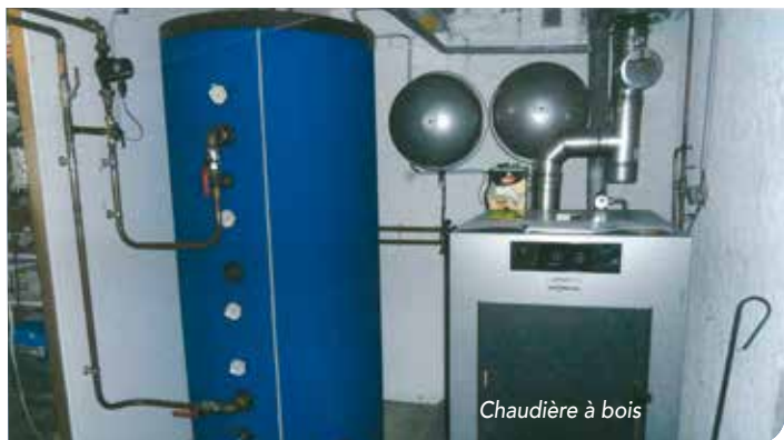
Chaudière à bois

NOUS ACCOMPAGNONS LES TRAVAUX D'AMÉLIORATION ÉNERGÉTIQUE DE VOTRE HABITAT EN VALORISANT LES CERTIFICATS D'ÉCONOMIES D'ÉNERGIES (CEE). JUSQU'AU 15 OCTOBRE 2018 IL EST POSSIBLE DE DÉPOSER UNE DEMANDE DE SUBVENTION.