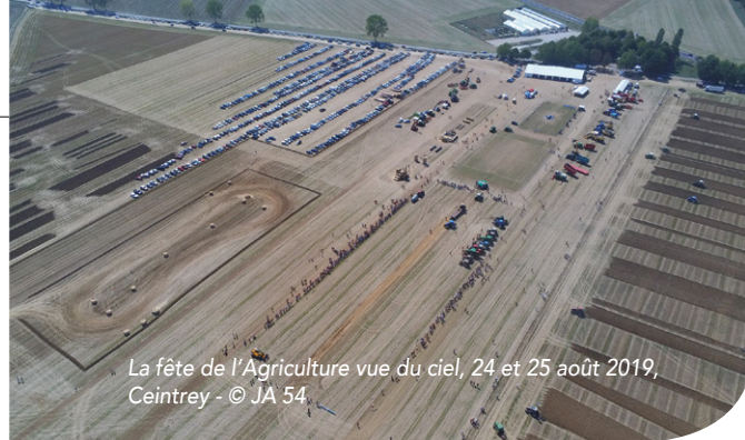
La fête de l'Agriculture vue du ciel, 24 et 25 août 2019, Ceintrey

Bravo aux jeunes agriculteurs et à tous leurs partenaires qui ont fait de la fête de l'agriculture à Ceintrey la réussite que l'on connaît.