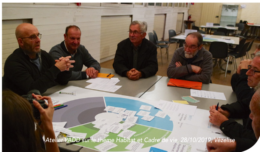
Atelier PADD sur le thème Habitat et Cadre de vie, 28/10/2019, Vézelize

LE PLAN LOCAL D'URBANISME INTERCOMMUNAL A ÉTÉ LANCÉ EN DÉCEMBRE 2018. LE BUREAU D'ÉTUDES EN CHARGE DE SON ÉLABORATION A EFFECTUÉ UN ÉTAT DES LIEUX ET UN RECUEIL DE DONNÉES EN COLLABORATION AVEC ÉLUS ET TECHNICIENS. CETTE PHASE APPELÉE « DIAGNOSTIC ET ÉTAT INITIAL DE L'ENVIRONNEMENT » VISE À METTRE EN ÉVIDENCE LES ENJEUX STRATÉGIQUES ET SPÉCIFIQUES DU TERRITOIRE.