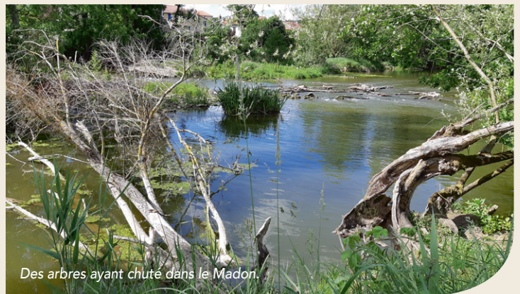
Des arbres ayant chuté dans le Madon.

Maxime Houpert – 03 83 52 47 93 maxime.houpert@ccpaysdusaintois.fr