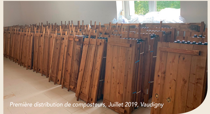
Première distribution de composteurs, Juillet 2019, Vaudigny