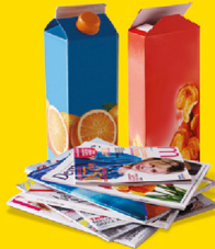
PAPIERS, EMBALLAGES ET BRIQUES EN CARTON