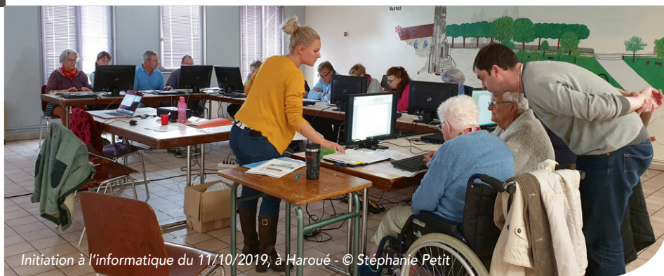
Initiation à l'informatique du 11/10/2019, à Haroué