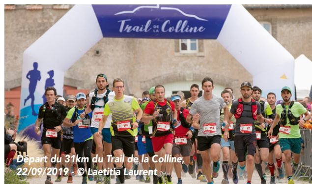
Départ du 31km du Trail de la Colline, 22/09/2019

Ce ne sont pas moins de 800 coureurs qui ont pris d'assaut la Colline de Sion à l'occasion du Trail de la Colline le 22 septembre dernier. Cette troisième édition soutenue par la CCPS a été un tel succès que le parcours de 15 km affichait complet un mois avant l'évènement ! Pour ce qui est des performances, le parcours de 31km a été bouclé en 2h14m chez les hommes, et 2h42m chez les femmes. Félicitations à tous les participants ainsi qu'aux organisateurs, et à l'année prochaine !