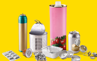
EMBALLAGES EN MÉTAL, MÊME LES PETITS