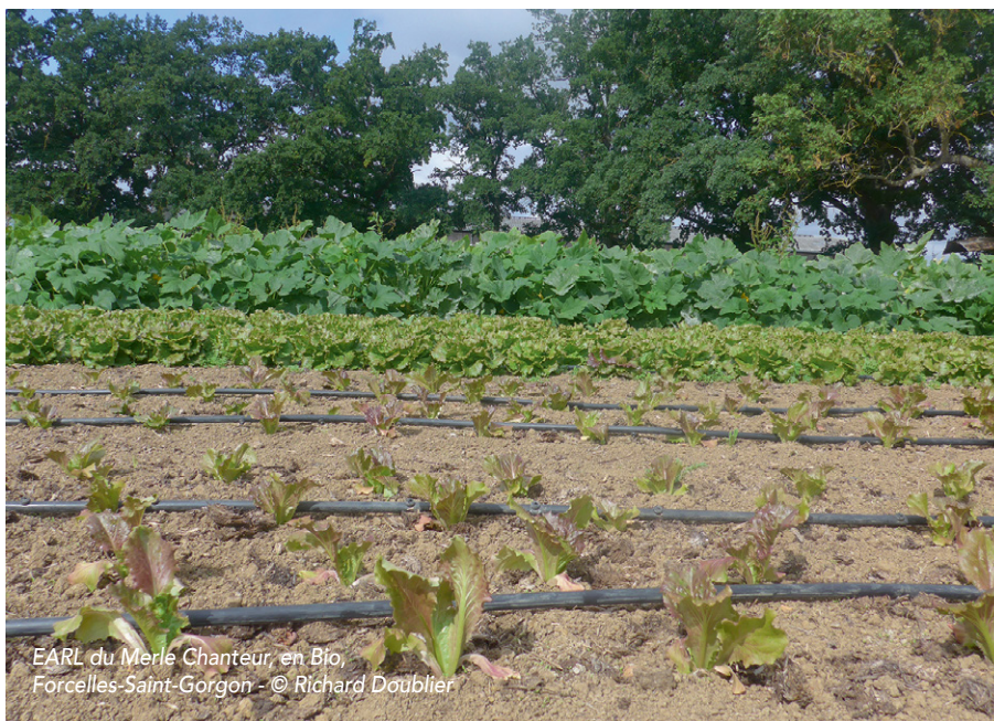
EARL du Merle Chanteur, en Bio, Forcelles-Saint-Gorgon