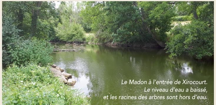
Le Madon à l'entrée de Xirocourt. Le niveau d'eau a baissé, et les racines des arbres sont hors d'eau.

La Communauté de Communes, qui a pris la compétence « Gestion des Milieux Aquatiques » en janvier 2018, a identifié cette problématique comme étant prioritaire. Elle a ainsi lancé un marché, afin de recruter un bureau d'études spécialiste des cours d'eau. Celui-ci aura pour mission de proposer des aménagements qui réduiront les effets néfastes des ouvertures dans les moulins. Il présentera également un plan de restauration de la végétation, de Battexey à Xirocourt. Pour cette étude, en partie financée par l'Agence de l'Eau Rhin-Meuse, la Communauté de Communes va s'associer avec l'EPTB Meurthe-Madon, un syndicat de gestion des milieux aquatiques et des inondations, opérant sur la partie vosgienne du projet. Tous ces partenaires, en concertation avec les riverains et les élus locaux, auront à cœur de trouver des solutions respectueuses des habitants du Madon, Hommes comme animaux et végétaux.