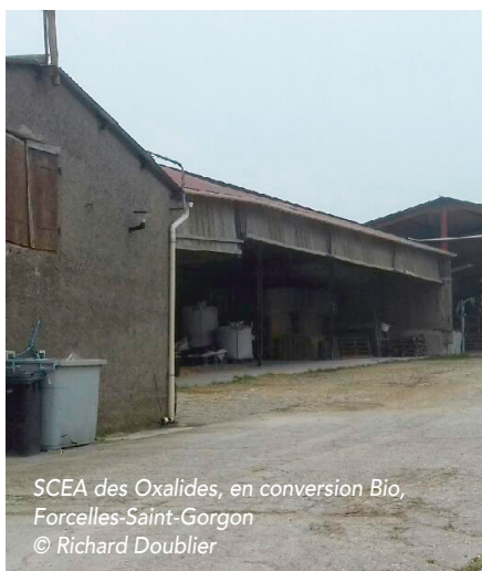
SCEA des Oxalides, en conversion Bio, Forcelles-Saint-Gorgon

Implantée depuis peu à Vézelize dans les anciens locaux de la CAL, PROBIOLOR (Produits Biologiques Lorrains) est une coopérative créée en 1991, qui a pour missions de collecter et valoriser uniquement des produits cultivés selon les règles rigoureuses de l'agriculture biologique, et d'approvisionner les adhérents en fonction de leurs besoins : semences, aliments du bétail. Elle assure le lien commercial entre le producteur et le transformateur. Son but est de vendre leurs céréales et oléo protéagineux au meilleur prix auprès des transformateurs de la filière.