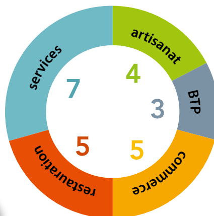
Nombre d'entreprises par secteur économique

Aurore Choux - 03 83 52 47 93 aurore.choux@ccpaysdusaintois.fr