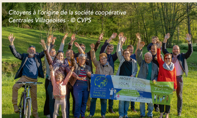
Citoyens à l'origine de la société coopérative Centrales Villageoises