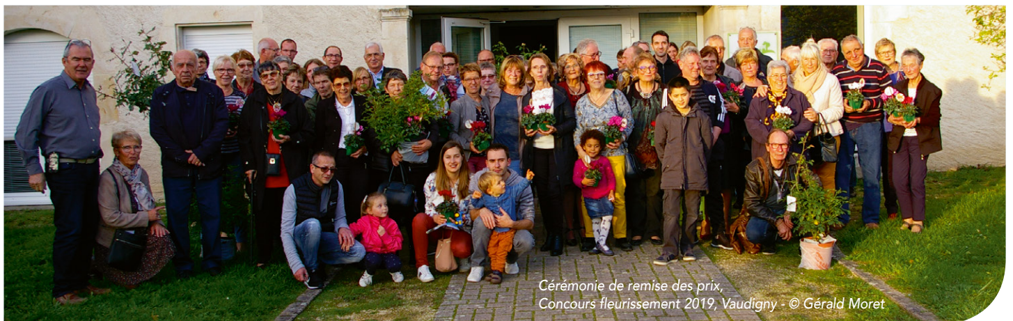
Cérémonie de remise des prix, Concours fleurissement 2019, Vaudigny