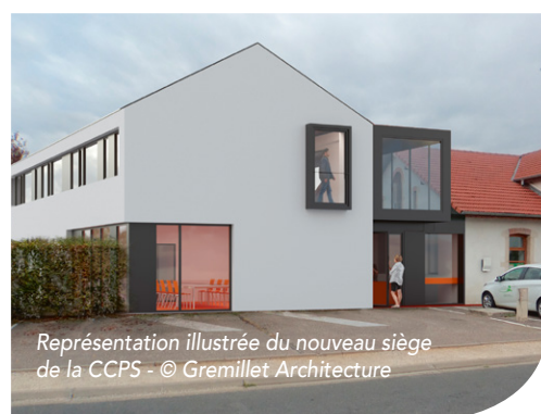
Représentation illustrée du nouveau siège de la CCPS - © Gremillet Architecture

Un nouveau bâtiment, extension des locaux actuels, va donc être construit, portant à 17 le nombre de bureaux disponibles pour une surface totale de 272m 2 . A cela s'ajoute une annexe de 82m 2 accueillant garages et atelier technique. Le coût des travaux s'élève à 1 215 095.44 € TTC pour une durée d'environ 8 à 10 mois.