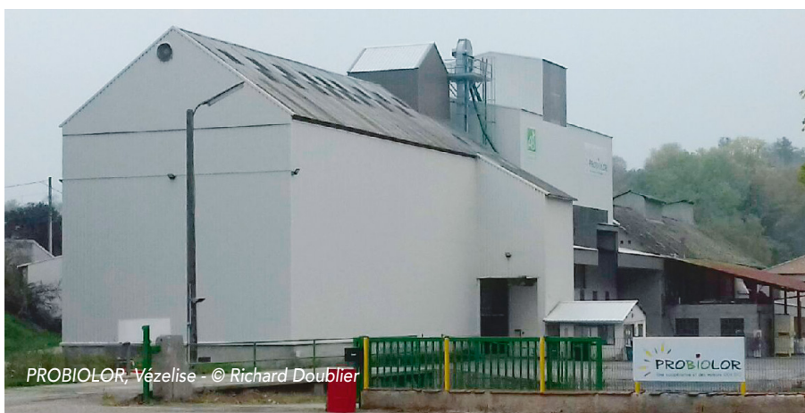
PROBIOLOR, Vézelize - © Richard Doublier

Une vingtaine d'agriculteurs du territoire ont fait le choix du BIO. Faire son marché 100% BIO est également possible en Meurthe et Moselle, grâce à l'association « Les Fermes Vertes » représentée dans le Saintois par l'Huilierie d'Ormes.