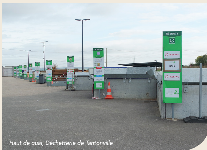
Haut de quai, Déchetterie de Tantonville