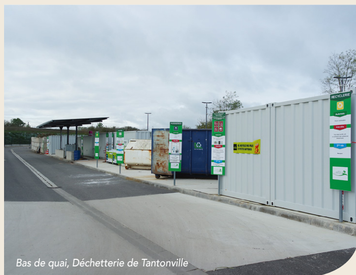
Bas de quai, Déchetterie de Tantonville