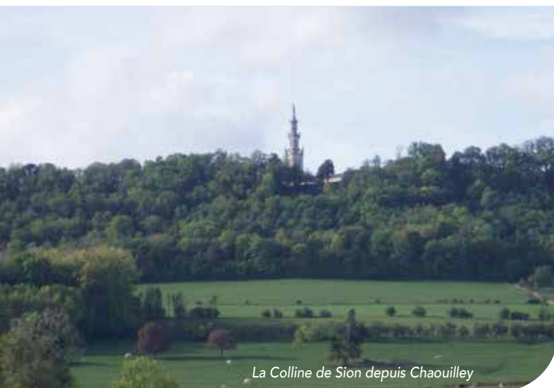
La Colline de Sion depuis Chaouilly