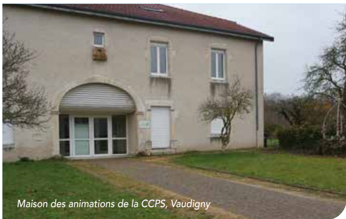
Maison des animations de la CCPS, Vaudigny

LA CCPS DISPOSE DEPUIS SEPTEMBRE 2017, ET CE, VIA UN BAIL EMPHYTÉOTIQUE D'UN NOUVEAU BÂTIMENT DÉNOMMÉ : LA MAISON DES ANIMATIONS. IL S'AGIT DE L'ANCIENNE MAISON DE L'ENVIRONNEMENT DU CONSEIL DÉPARTEMENTAL, SITUÉE AU 13 RUE DE JANTIVAL À VAUDIGNY .