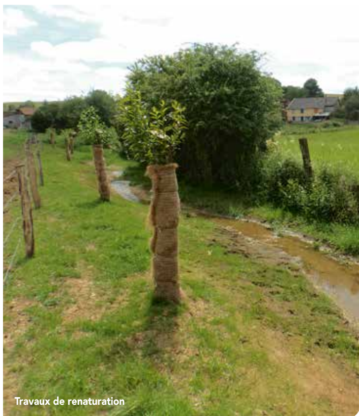
Travaux de renaturation