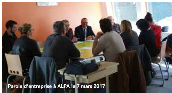
Parole d'entreprise à ALPA le 7 mars 2017

L'ASSOCIATION « PAROLE D'ENTREPRISES », CRÉÉE DEPUIS 10 ANS SUR LE TOULOUS, SOUHAITE SE STRUCTURER SUR NOTRE TERRITOIRE OÙ IL N'EXISTE ACTUELLEMENT AUCUN RÉSEAU D'ENTREPRISES. SON OBJECTIF EST DE :