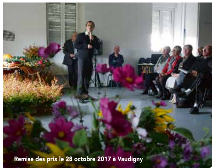
Remise des prix le 28 octobre 2017 à Vaudigny

ingénieur paysagiste, au sujet de la permaculture a suscité un vif intérêt. Il y était question des pratiques de jardinage aussi bien à l'échelle individuelle (jardin privé) que collective (jardin partagé d'Ognéville). Le Président de la CCPS a tenu à remercier les bénévoles, les communes participantes ainsi que les habitants, car ils contribuent à l'attractivité et à la qualité du cadre de vie du territoire.