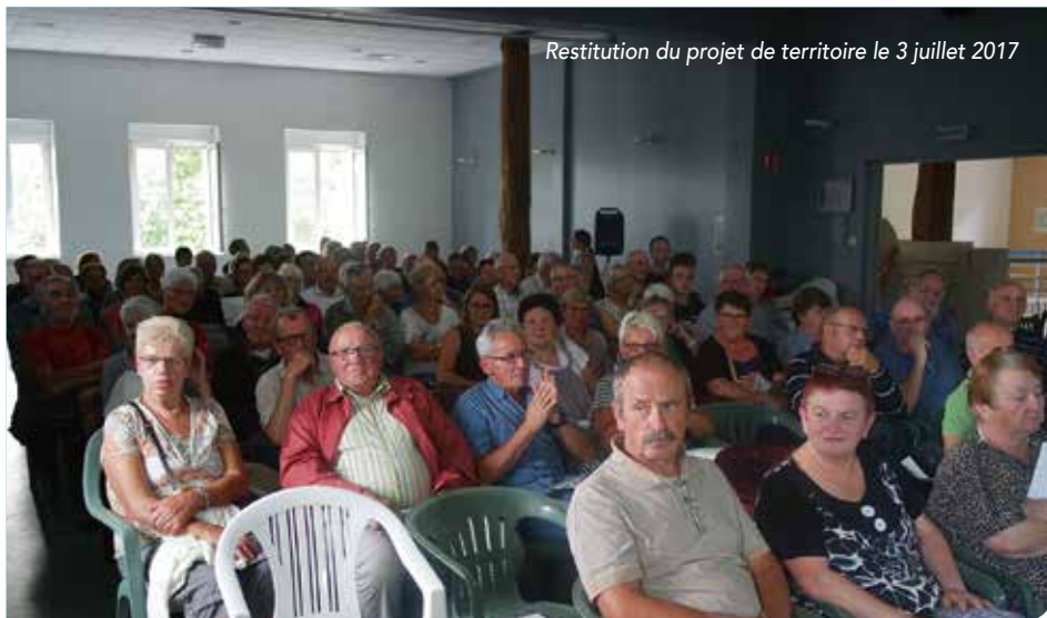
Restitution du projet de territoire le 3 juillet 2017

Plus de 120 personnes étaient présentes lors de cette restitution, elle s'est clôturée par un spectacle de la compagnie Crache texte et un repas convivial.