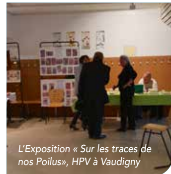
L'Exposition « Sur les traces de nos Poilus », HPV à Vaudigny