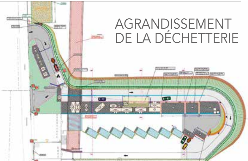
Plan de la future déchetterie de Tantonville >

Suite à l'étude préalable et à la sélection d'un maître d'œuvre, le projet définitif est en cours de réalisation. Les travaux de la déchetterie vont commencer en janvier 2018. Le site restera ouvert au public pendant toute la durée des travaux. À compter de l'été 2018, la circulation se fera désormais à sens unique avec une entrée et une sortie bien définies, et un contrôle d'accès à l'entrée via la carte d'accès de la déchetterie. Ces travaux vont permettre de mettre en place une ressourcerie, de trier les déchets verts (séparer la tonte des branchages), de collecter les pneus de véhicules légers, les films plastiques, le polystyrène, les huisseries et le plâtre.