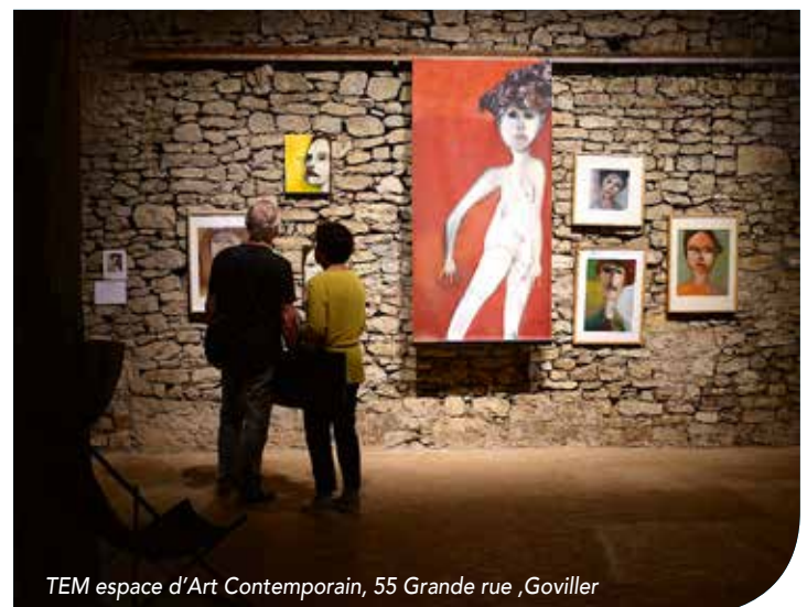
TEM espace d'Art Contemporain, 55 Grande rue, Goviller