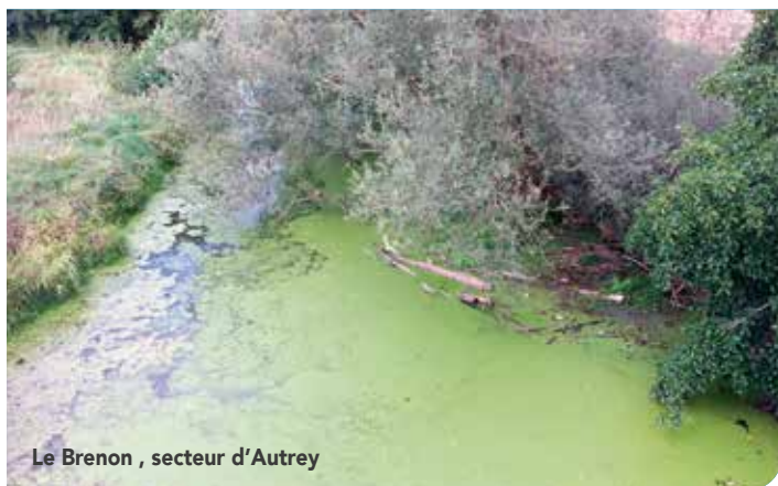
Le Brenon , secteur d'Autrey