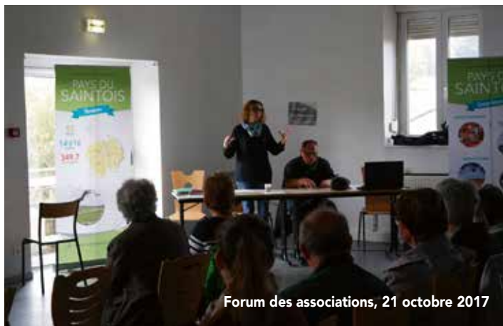
Forum des associations, 21 octobre 2017

DANS UN PROJET DE TERRITOIRE, LE MONDE ASSOCIATIF PREND UNE PLACE PRÉ- PONDÉRANTE À SON DÉVELOPPEMENT. IL EST AU PLUS PROCHE DES HABITANTS, FACILITE LA VIE DES FAMILLES, PROPOSE DES ACTIVITÉS CULTURELLES, SOCIALES, SPORTIVES RICHES ET VARIÉES ET CONTRIBUE AU MIEUX-ÊTRE DES HABITANTS DU SAINTOIS.