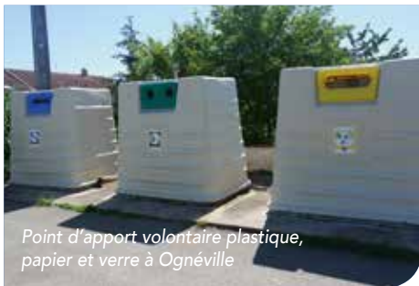
Point d'apport volontaire plastique, papier et verre à Ognéville

Toute erreur de tri dans une borne entraîne un refus de tri au centre de tri. Le taux de ces refus sur les déchets plastiques atteint 26,3 %. Ces refus de tri sont facturés à la CCPS et engendrent une hausse de votre facture. Pour bien trier, se référer aux consignes de tri qui ont été diffusées et que vous pouvez retrouver sur le site internet de la CCPS .