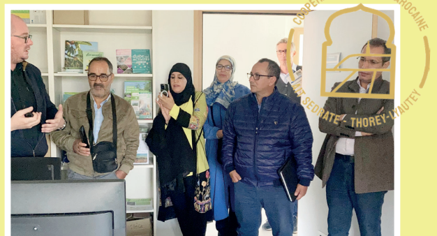
La délégation marocaine lors de sa visite des locaux de la CCPS, à Tantonville

Au programme : un atelier culinaire, un concert de musique orientale avec restauration, deux conférences et un atelier de contes. Le tout dans le cadre privilégié du Château Lyautey !