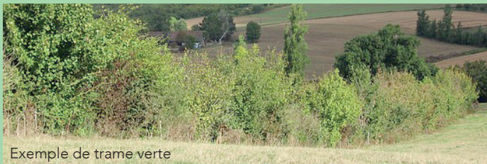
Exemple de trame verte

Une première action sur trois communes est menée au nord-ouest du territoire pour reconnecter le bois de Goviller avec la ripisylve du Brénon.