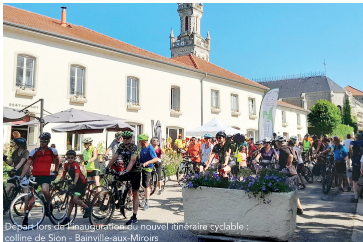
Départ lors de l'inauguration du nouvel itinéraire cyclable : colline de Sion - Bainville-aux-Miroirs