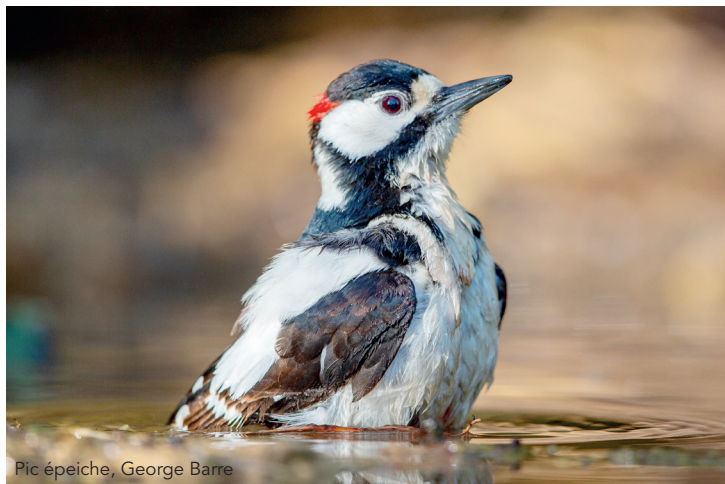
Pic épeiche, George Barre